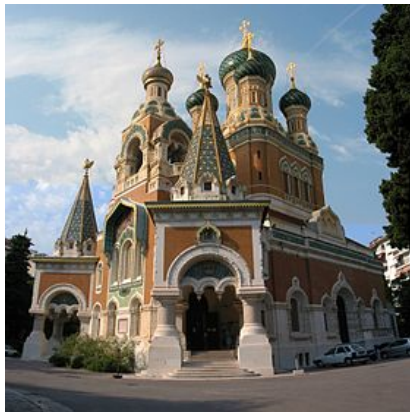
Cathédrale Saint Nicolas (boulevard du Tzarévitch, Nice)

Les croyances religieuses des maçons des Alpes-Maritimes oscillent entre un « Déisme » parfois teinté d'anticléricalisme (anticatholicisme) et une pratique religieuse « Orthodoxe » au sein des églises établies.